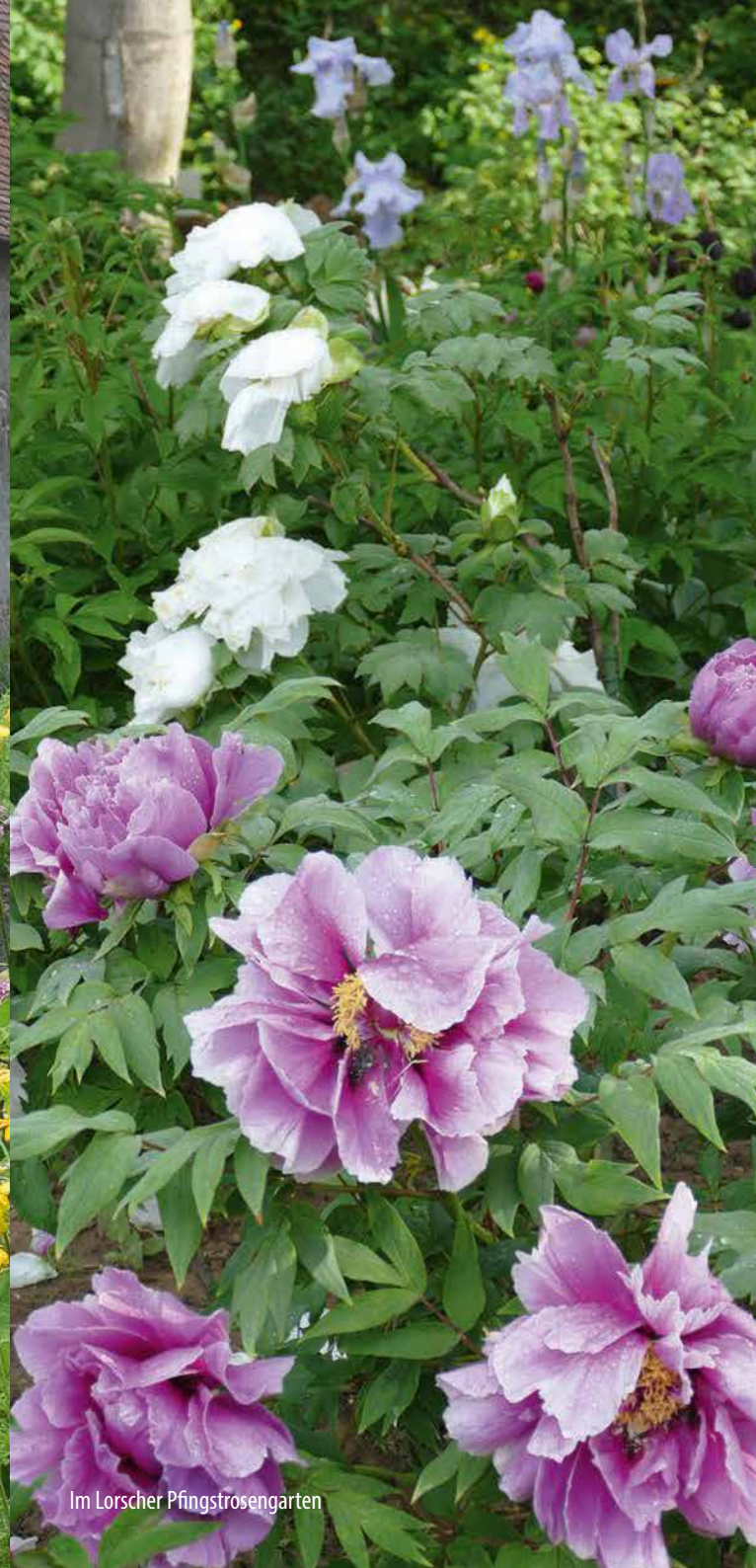
Im Lorsche Pfingstrosengarten