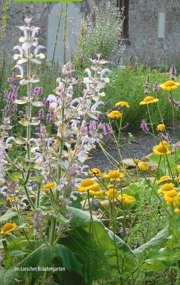
Im Lorsche Kräuter Garten